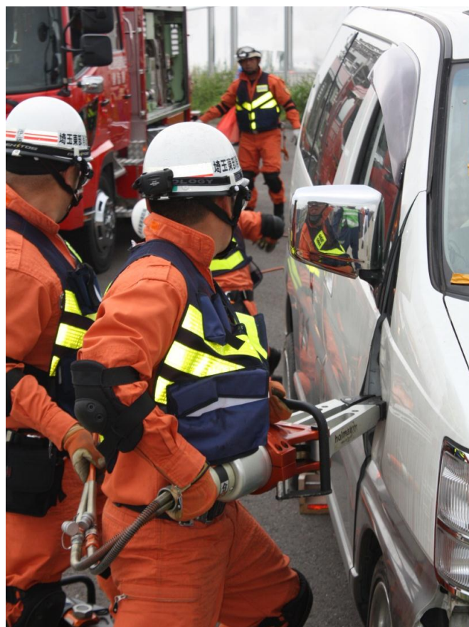
(九都県市 白岡菖蒲I.C.高速道路会場)