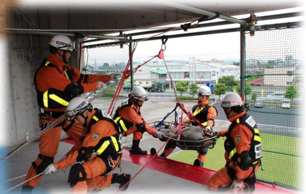
(特別救助隊高所救出訓練)