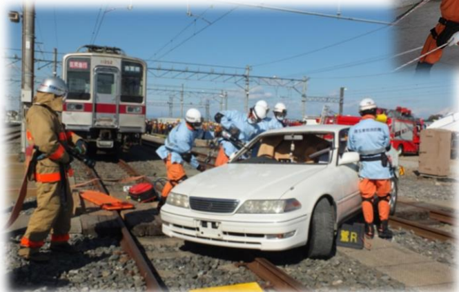
(東武鉄道異常時総合訓練)