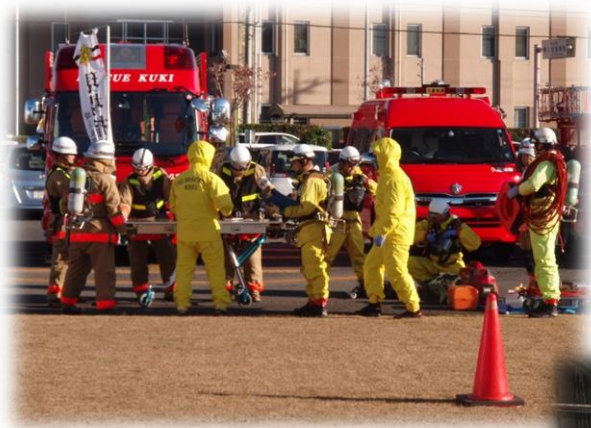
(平成26年度消防組合内消防訓練)