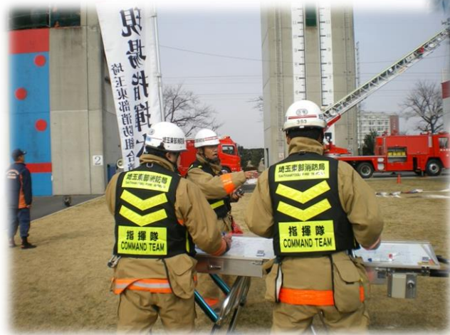
(平成27年度消防組合内消防訓練)