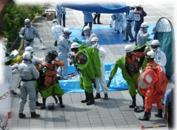
(特殊災害対応合同訓練)