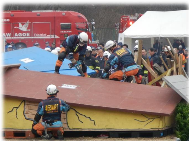
(平成27年度埼玉県特別機動援助隊合同訓練)