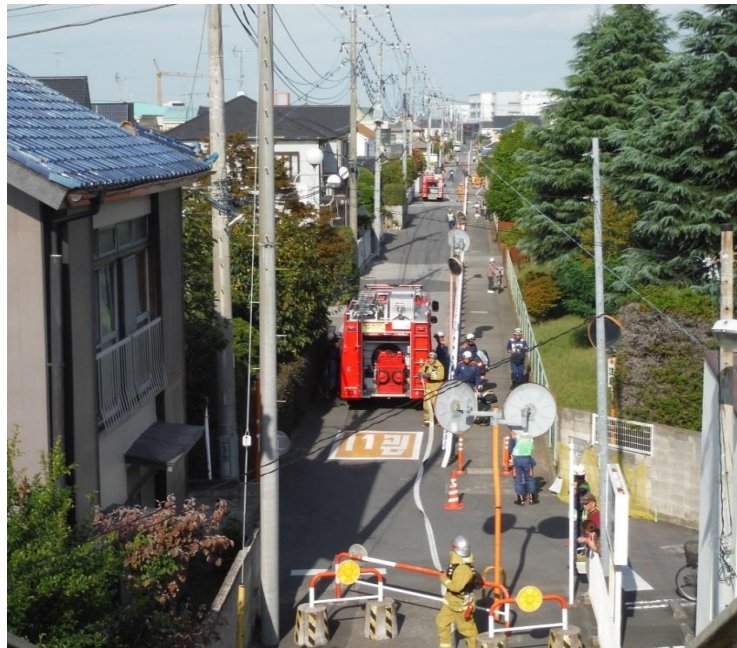
(遠距離中継送水訓練)

平成29年度埼玉県第4ブロック緊急消防援助隊合同訓練が10月に当組合管内で開催されました。