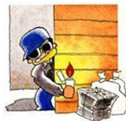
燃えやすいものを置かない