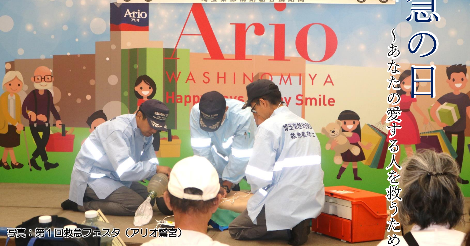
写真：第1回救急フェスタ（アリオ鷺宮）