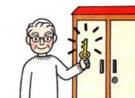
物置・車庫には鍵を