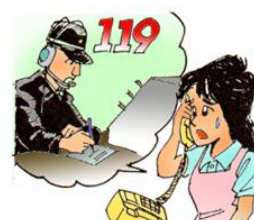
火災を発見したら119番